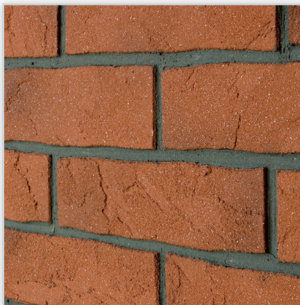
Inesta, Elastyczne płytki elewacyjne IZOFLEX, Wzór: Stara Cegła. Wykończenie: 2 kolory. Materiał: na bazie żywicy syntetycznej. Montaż: na kleju IZOFLEX-SK. Wymiary [mm]: dł./szer. – 240/(52, 65, 71), 360/(52, 65, 71), grubość – 3.