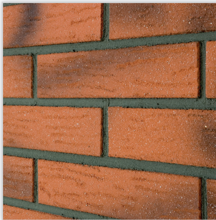
Inesta, Elastyczne płytki elewacyjne IZOFLEX, Faktura: rustykalna. Wykończenie: 12 kolorów. Materiał: na bazie żywicy syntetycznej. Montaż: na kleju IZOFLEX-SK. Wymiary [mm]: dł./szer. – 240/(52, 65, 71), 360/(52, 65, 71), grubość – 3.