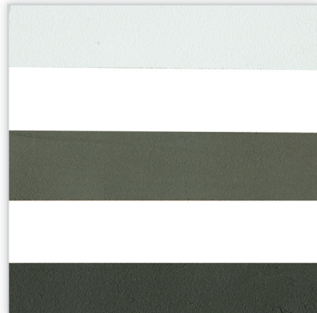
Inesta, Trwale elastyczny klej IZOFLEX-SK do przyklejania płytek IZOFLEX. Materiał: na bazie żywicy syntetycznej, stanowi jednocześnie fugę. Wykończenie: 3 kolory.