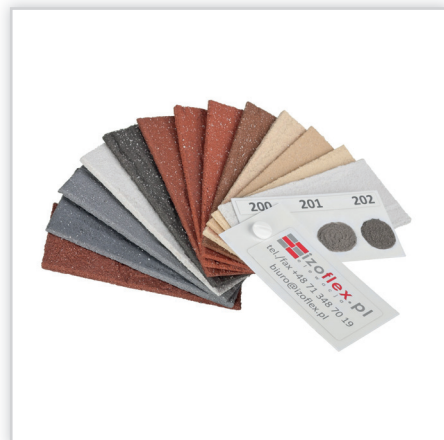
Inesta, Paleta kolorystyczna płytek IZOFLEX. Dwanaście kolorów, trzy rozmiary, trzy faktury.