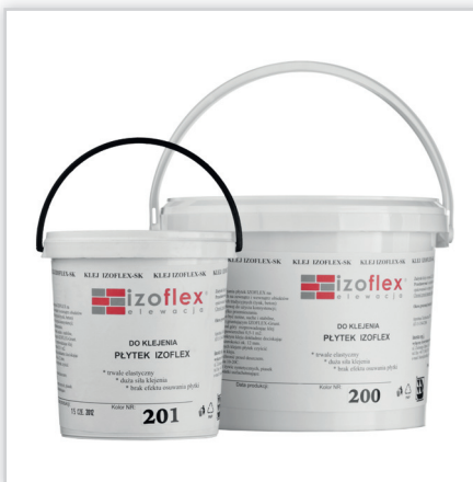
Inesta, Klej IZOFLEX-SK do przyklejania płytek IZOFLEX. Produkowany w gotowej do użycia konsystencji, konfekcjonowany w wiadrach o różnej pojemności.