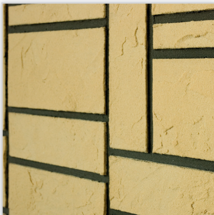
Inesta, Elastyczne płytki elewacyjne IZOFLEX, Wzór: Mozaika-Kamieli. Wykończenie: 10 kolorów. Materiał: na bazie żywicy syntetycznej. Montaż: na kleju IZOFLEX-SK. Wymiary [mm]: dł./szer. – 240/(115, 70, 30), grubość – 3.