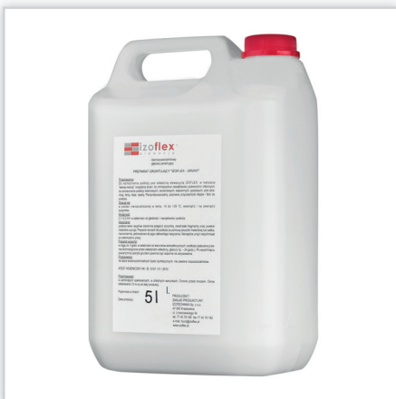
Inesta, Preparat do gruntowania podłoży pod okładzinę IZOFLEX. Materiał: na bazie żywicy syntetycznej.