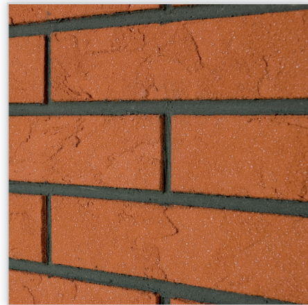
Inesta, Elastyczne płytki elewacyjne IZOFLEX, Faktura: fuppek. Wykończenie: 12 kolorów. Materiał: na bazie żywicy syntetycznej. Montaż: na kleju IZOFLEX-SK. Wymiary [mm]: dł./szer. – 240/(52, 65, 71), 360/(52, 65, 71), grubość – 3.